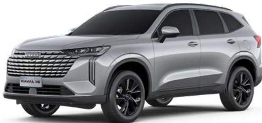
Ayers Grey (Metallic)