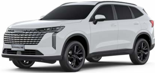
Moonlight White (Metallic)

Wählen Sie den Haval H6, der perfekt zu Ihnen passt. Dafür stehen Ihnen eine Palette eleganter Karosseriefarben sowie zwei Ausstattungsvarianten – Premium und Luxury – zur Verfügung.