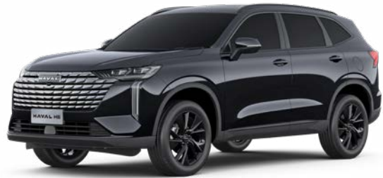
Starry Black (Metallic)