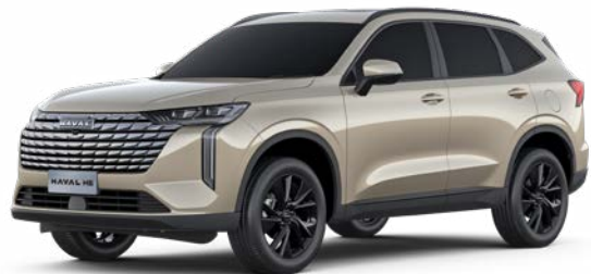
Noble Gold (Metallic)